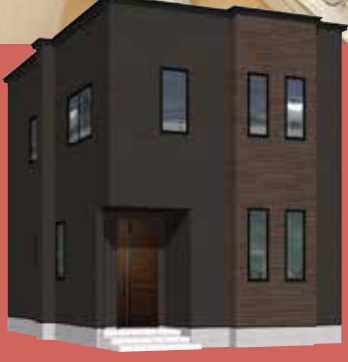
新築 (R05 確認建セ弘 青森 第 0044 号)