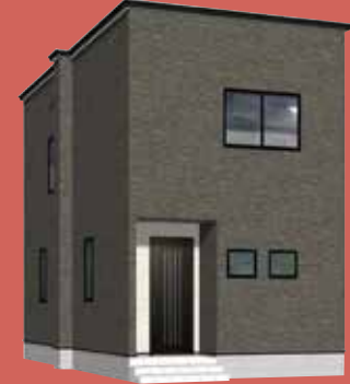
新築 (R05 確認建セ弘 青森 第 0045 号)