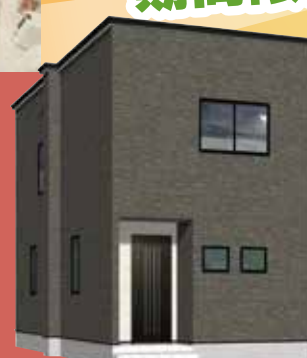
新築 (R05 確認建七弘 青森 第 0045 号)

※当社の店舗の総額になります。 キャッシュバック額は物件により 異なりますのでご了承ください。