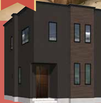
新築 (R05 確認建七弘 青森 第 0044 号)